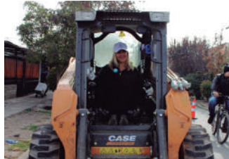
✓ Nuestra Diputada participando de la limpieza de residuos de gran tamaño en la comuna de La Pintana.